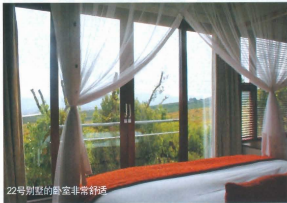
22号别墅的卧室非常舒适

最后老板还炫耀说, 好莱坞明星布 拉德·彼特曾下榻22号别墅, 恰好就是 我住的那栋, 同行者无不羡慕, 事实上 每栋别墅并无不同。但值得一提的是, 当夜一场暴雨突然而至, 狂风激怒了大 海, 层层白浪拍向海岸, 云层压抑下、 灌木摇曳中的Grootbos让我恍若置身呼 啸山庄, 只是不知当年布拉德·彼特有否 有幸看到同样惊心动魄的风景? COSMO