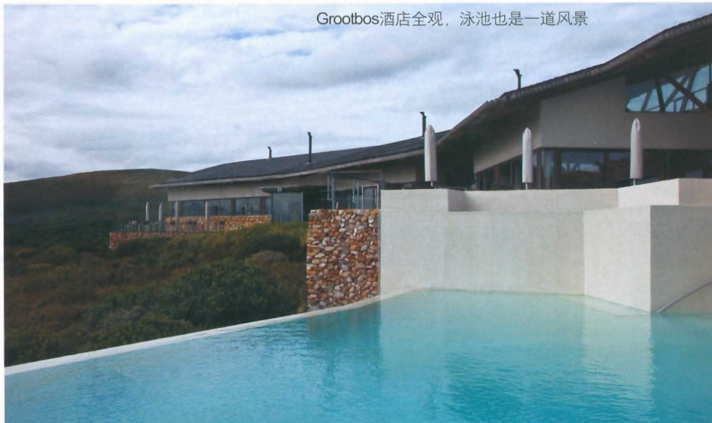
Grootbos酒店全观, 泳池也是一道风景