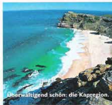
Überwältigend schön: die Kapregion.

→ Anreise: Täglich Linienflüge mit South African Airways von Frankfurt a. M. und München nach Johannesburg und von dort in alle großen Städte Südafrikas. www.flysaa.com . Rail&Fly, der Bahnzubringer zum deutschen Flughafen, ist bei SAA inklusive. www.bahn.de/bahnflug