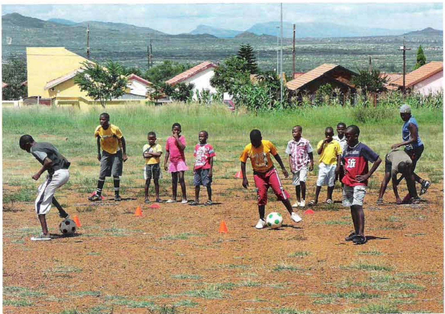
Schule fürs Leben: Im Township Soshanguve üben die »stars of tomorrow«. Einer (rechts) legt mit Stöckchen den Satz »Aids is real« auf den Platz.