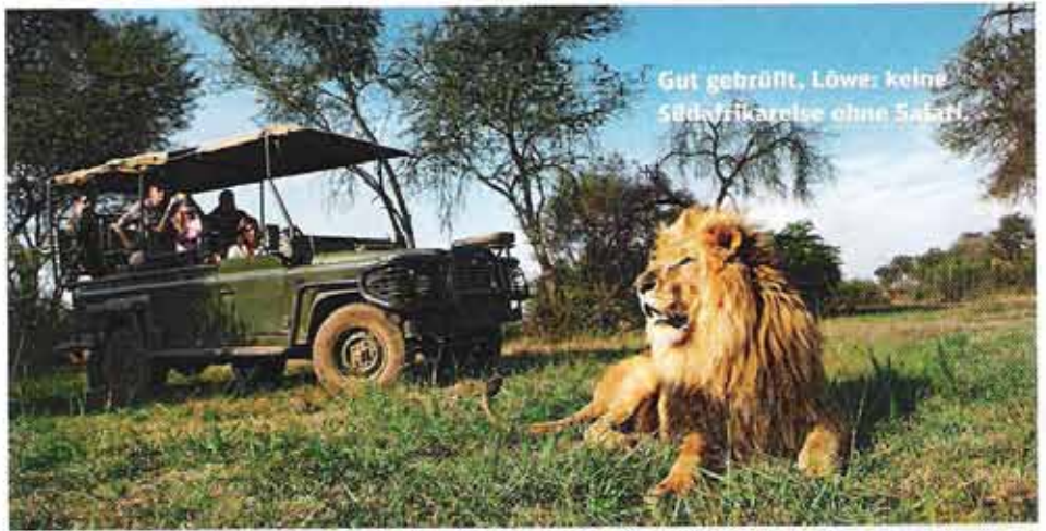
Gut gebrüht. Löwe: keine Südafrikareise ohne Safari