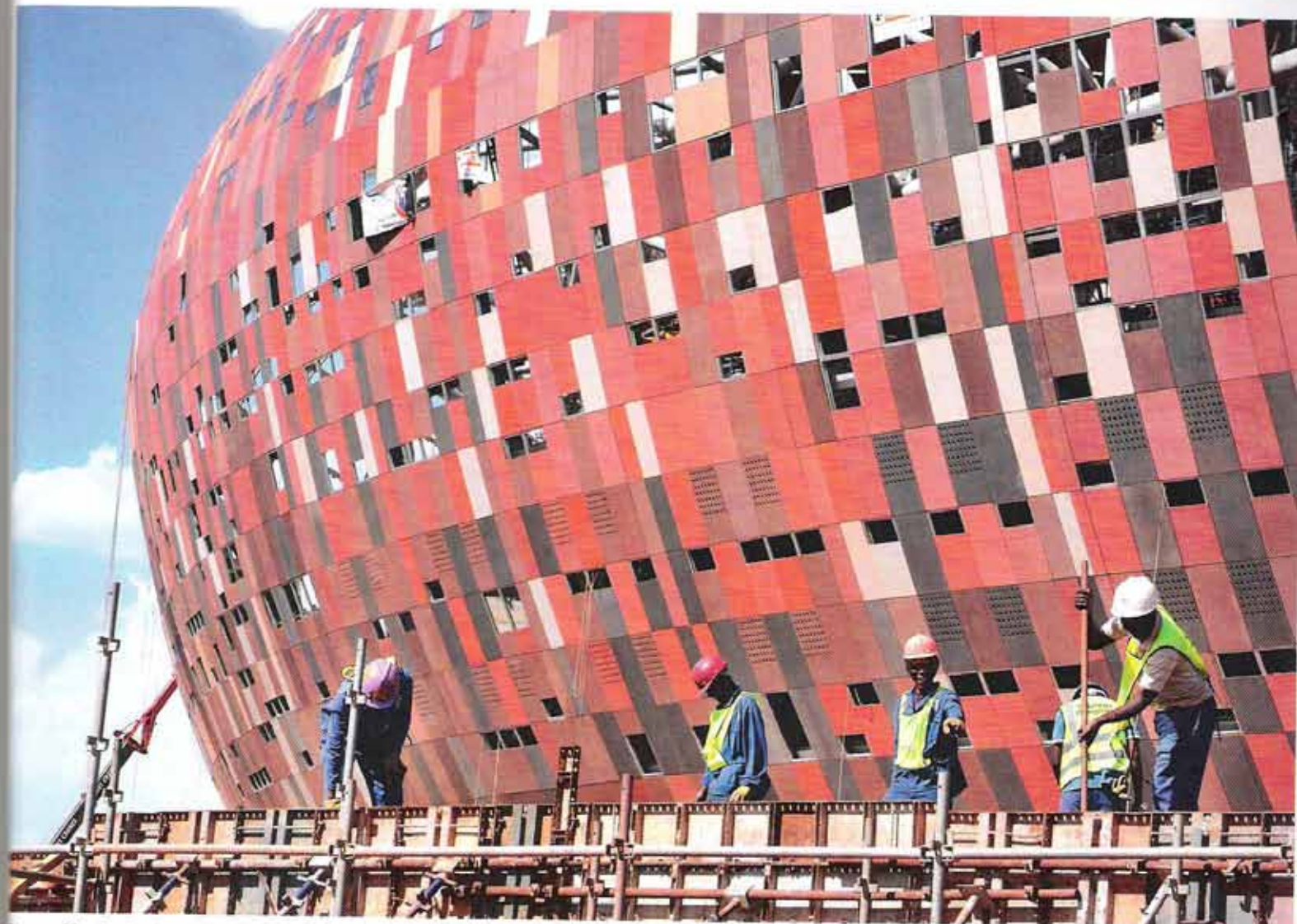
Bauen für den Ruhm Südafrikas: In Soccercity bei Johannesburg wird das größte Stadion errichtet. Form und Farbe erinnern an eine Kalebasse.